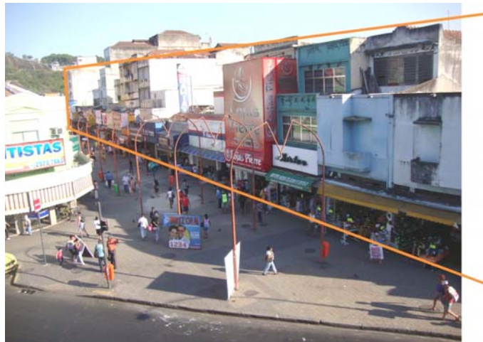
Figura 3: Morfologia Rua dos Romeiros Fonte: Autor, 2010.

Essa área de análise pode ser encarada como uma das centralidades do bairro da Penha, uma área de fluxos que se dilata em um largo, concentrando o uso misto, com maior predominância de comércio.